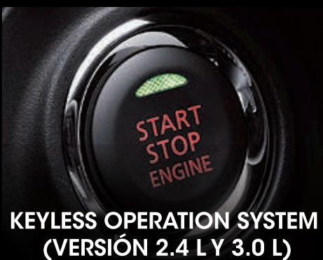
KEYLESS OPERATION SYSTEM (VERSIÓN 2.4 L Y 3.0 L)