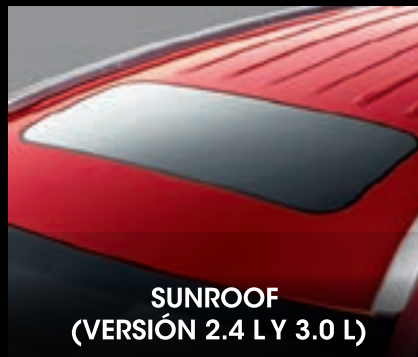
SUNROOF (VERSIÓN 2.4 L Y 3.0 L)