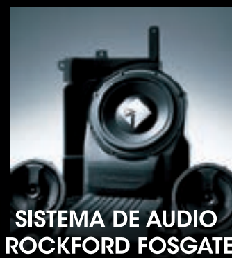
SISTEMA DE AUDIO ROCKFORD FOSGATE