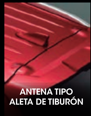
ANTENA TIPO ALETA DE TIBURÓN