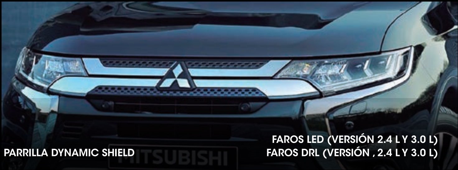
PARRILLA DYNAMIC SHIELD