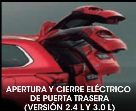
APERTURA Y CIERRE ELÉCTRICO DE PUERTA TRASERA (VERSIÓN 2.4 L Y 3.0 L)