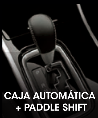
CAJA AUTOMÁTICA + PADDLE SHIFT