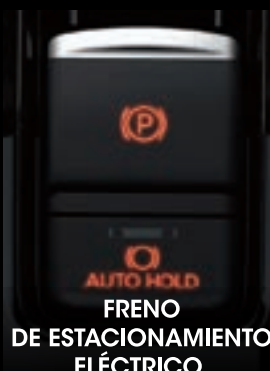
FRENO DE ESTACIONAMIENTO ELÉCTRICO