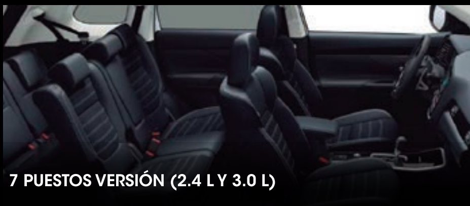
7 PUESTOS VERSIÓN (2.4 L Y 3.0 L)