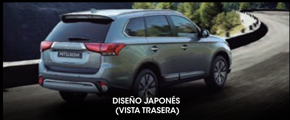
DISEÑO JAPONÉS (VISTA TRASERA)